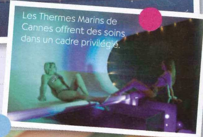
Les Thermes Marins de Cannes offrent des soins dans un cadre privilégié.